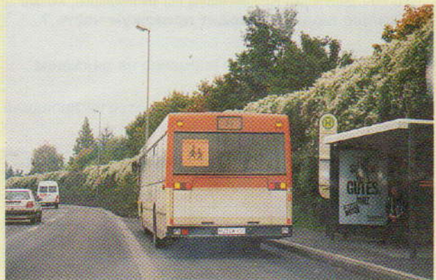
(Аварийная сигнализация включена)