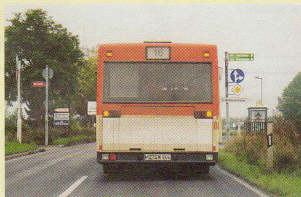
4 (Аварийная сигнализация включена)