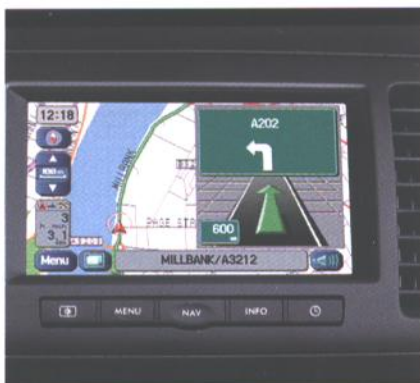
Večfunkcijski displej (3.0)