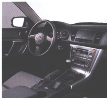
Vozniški prostor (2.0)