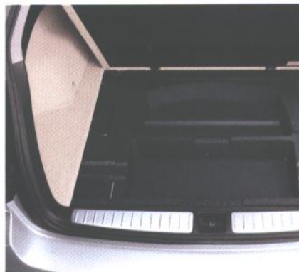
Prostori pod prtljažnim prostorom