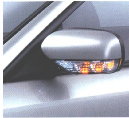
Zunanje ogledalo z vgrajenim LED smernim kazalcem