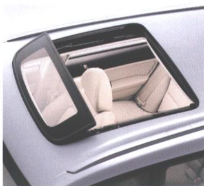
Dvojna sončna streha (opcija)