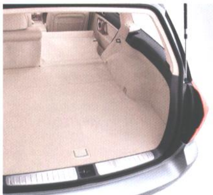
60/40 razdeljen prtljažni prostor