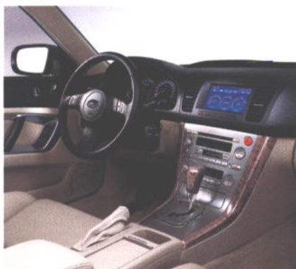
Vozniški prostor (3.0)