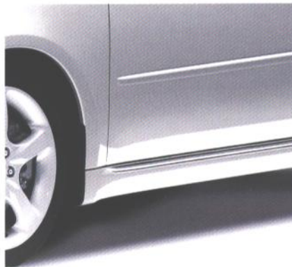
Stranski spoiler (3.0)